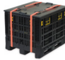
Grandes contenedores plegables (FLC por sus siglas en inglés)