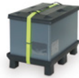
Contenedores plegables con o sin tapa amovible